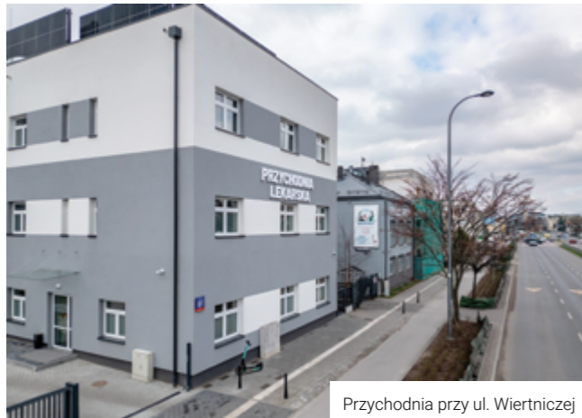
Przychodnia przy ul. Wiertniczej