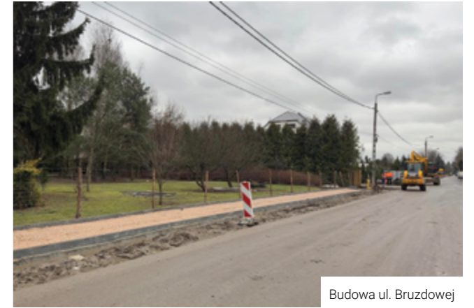
Budowa ul. Bruzdowej