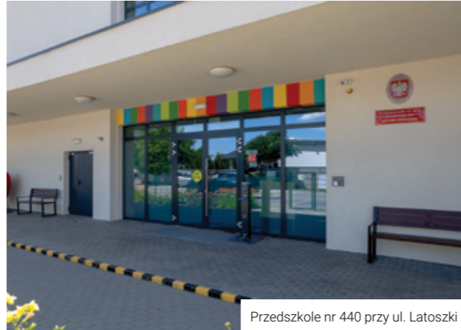
Przedszkole nr 440 przy ul. Łatoszki