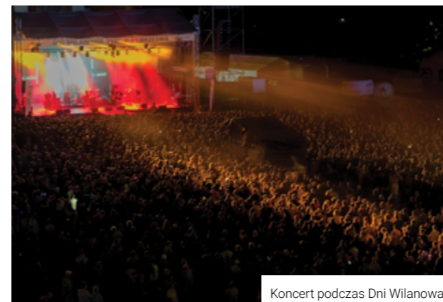
Koncert podczas Dni Wilanowa