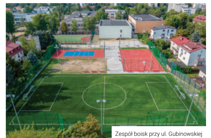
Zespół boisk przy ul. Gubinowskiej