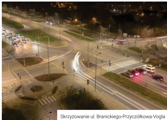
Skrzyżowanie ul. Branickiego-Przyczółkowa-Vogla