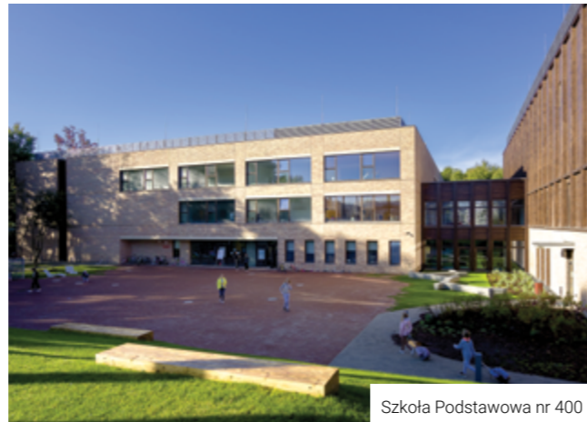
Szkoła Podstawowa nr 400