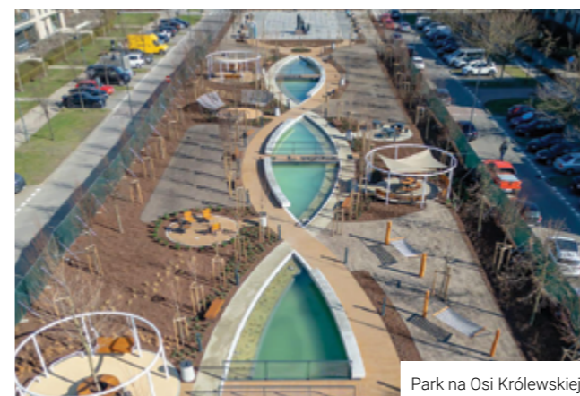
Park na Osii Królewskiej