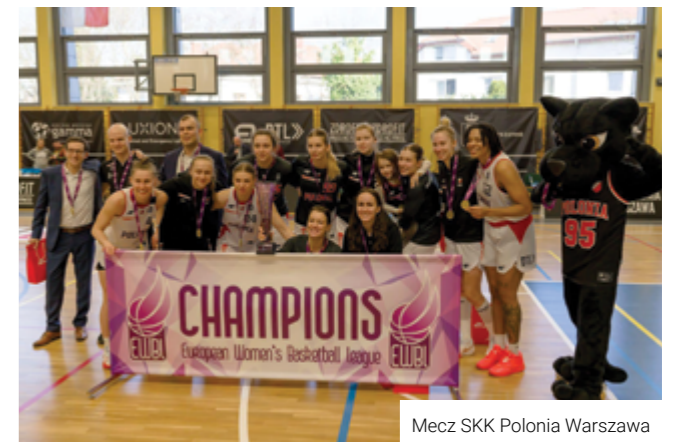
Mecz SKK Polonia Warszawa