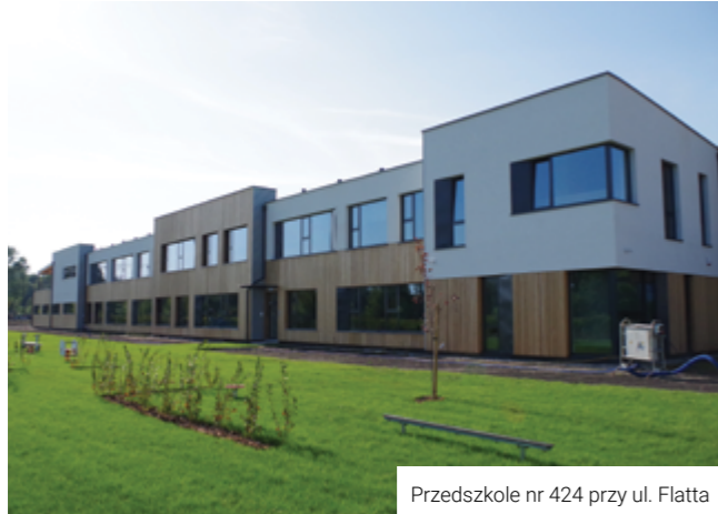
Przedszkole nr 424 przy ul. Flatta