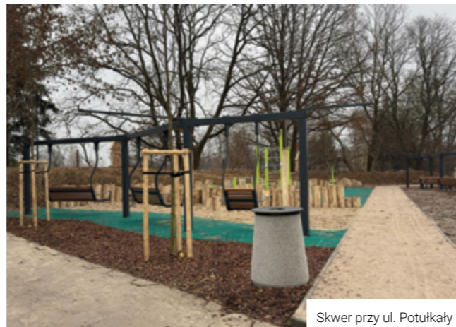
Skwer przy ul. Potulkały