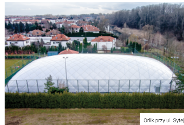
Orlik przy ul. Sytej